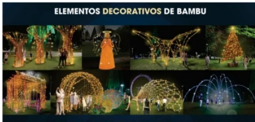
Decorações de bambu que serão instaladas na Praça da Catedral de Maringá.

Uma das grandes novidades deste ano é a decoração mais sustentável. Os elementos decorativos da praça da Catedral serão feitos a base de bambu (veja fotos) , diminuindo o consumo e descarte de fios e estruturas de metal. O objetivo é atrair ainda mais visitantes, já que 82% dos turistas brasileiros afirmam que buscam destinos mais ecológicos em suas próximas viagens.